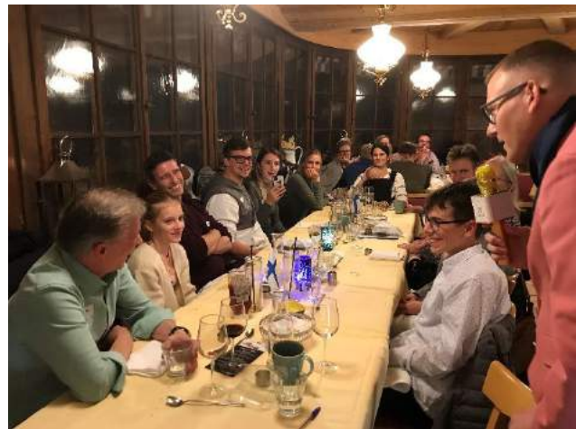
Glögi in Wil 02. – 04.12.2022